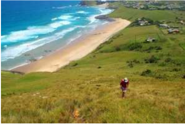
La Wild Coast, l'une des régions les plus sauvages de l'Afrique du Sud.

On le sait tous, rien ne vaut une expérience immersive pour progresser rapidement dans une langue. Alors même s'il existe de nombreuses formations à Paris, pourquoi ne pas profiter d'un séjour au bout du monde, pour s'y remettre, tout en changeant d'air et découvrant d'autres cultures ?